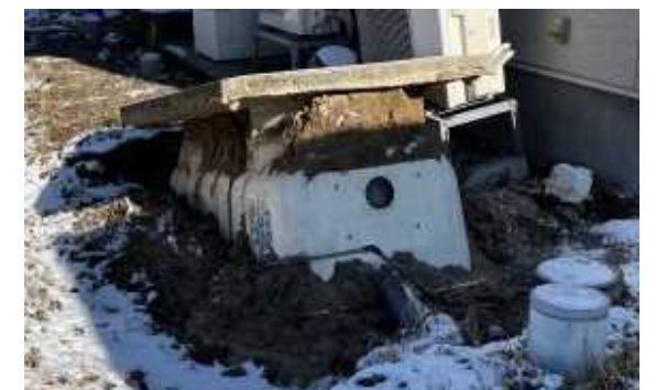
地震により浮き上がった浄化槽 (画像は七尾市内の例)